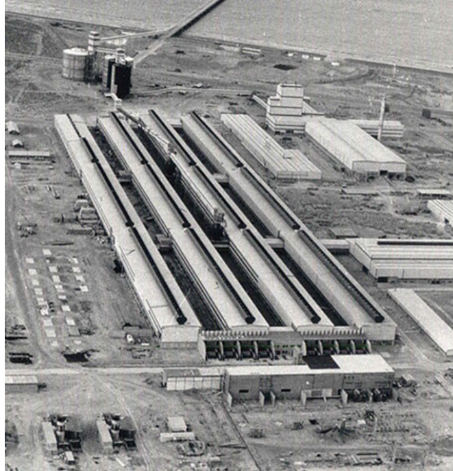
Fig. 1. Planta de Aluar en Puerto Madryn, año 1974.

La capacidad técnica adquirida para la fabricación de calculadoras en la División Electrónica había sido esgrimida por FATE como una demostración de que la empresa podía encarar proyectos tecnológicos complejos [6]. 3 Esas capacidades acumuladas en la División Electrónica, en medio de la crisis que atravesaba la producción de calculadoras tras los cambios arancelarios en la importación de componentes posteriores al golpe de estado de 1976 –que hicieron que fuese más costoso importar las partes de una calculadora que una terminada– serían nuevamente utilizadas como un insumo estratégico por parte de ALUAR.