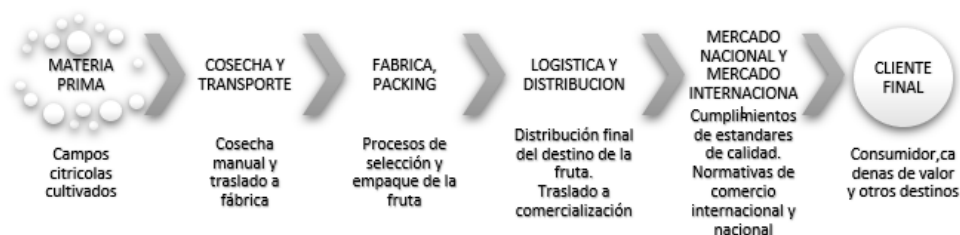
Fig. 4: Cadena de suministros. Elaboración propia

• Identificación y definición de las funciones para cada puesto de trabajo, para realizar el mismo de manera efectiva, fácil y sencilla. La rotación de puestos es un enfoque para el desarrollo de la gestión, en el que un individuo se mueve a través de un programa de asignaciones diseñado para brindarle una amplia exposición a toda la operación. La rotación laboral también se practica para permitir que los empleados calificados obtengan más conocimientos sobre los procesos de una empresa y para aumentar la satisfacción laboral a través de la variación laboral. Dicha rotación deberá diseñarse de manera que se minimice, y que permita al empleado brindar lo mejor de su capacidad al servicio de la empresa.