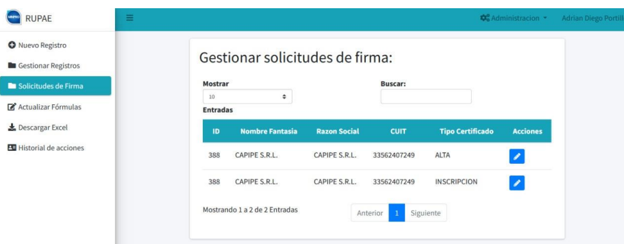
Fig. 2. Bandeja de firmas pendientes en el sistema RUPAE.

El RUPAE - Registro Único de Proveedores de Actividades Económicas de la Provincia de Santa Cruz [5], tiene como finalidad facilitar la vinculación entre los proveedores santacruceños y las distintas empresas que operan en la provincia, con el objetivo de incrementar el comercio local. Está a cargo del Ministerio de la Producción, Comercio e Industria (MINPRO). El sistema informático que utiliza actualmente fue desarrollado por la Dirección de Proyectos de Innovación dependiente de la Secretaría de Estado de Modernización e Innovación Tecnológica de la Provincia de Santa Cruz. Es un sistema orientado a web, con el que los usuarios responsables del MINPRO pueden gestionar las altas, bajas y modificaciones de proveedores en el registro. Además, desde el sistema se pueden actualizar los valores de fórmulas del cálculo interno de scoring de comercio local, exportar la información en hojas de cálculo y también, relacionado con la solución que estamos comentando, efectuar la firma digital de certificados originados en el sistema con la Plataforma de Firma Digital Remota (PFDR) de Nación, pasando de manera triangulada y transparente para los usuarios por “Firmar-API Santa Cruz”, y sin necesidad de abandonar el sistema para ello (Figura 2).