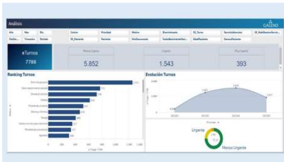
Fig. 1. Dashboard que muestra los datos generados a partir de la aplicación TTS

Con la finalidad de poder disponer de información que permitan conocer las características de la población asistida en las guardias, se ha desarrollado un dashboard en la plataforma de Business Intelligence con indicadores de triage que se actualizan cada 24 horas. En ella se muestran la cantidad de triage realizados y sus prioridades en forma de KPI. Se dispone de un gráfico que permite ver la evolución de la cantidad de triage realizados por periodo y de un gráfico de barras donde se puede discriminar los principales motivos de consulta, discriminantes así como la composición de la población de acuerdo a género. (Fig 1) Al mismo tiempo consta de una hoja detalle en la cual es posible realizar consultas combinadas de las distintas variables registradas.